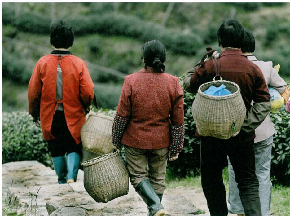
Wuyibergen drabbades också av den kalla vintern och i början av april hade plockningen knappt kommit igång. Klippteerna plockas endast under några hektiska veckor på våren.