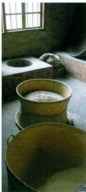
De nyskördade tebladen läggs i bambukorgar som ställs över het stenkol i det runda hålet vid fönstret. Temakaren känner sedan på lukten när bladen är färdigrostade!

Ibland driver denne ingen odling själv utan köper in bladen separat och sätter sin signatur på teet med tillredningen.